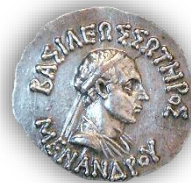
Νόμισμα του Μενάνδρου. Πρόσθια όψη: «ΒΑΣΙΛΕΩΣ ΣΩΤΗΡΟΣ ΜΕΝΑΝΔΡΟΥ»

Ο Μένανδρος Α΄, ο οποίος έχει περιγραφεί ως ο μεγαλύτερος και πιο διάσημος των Ελληνοϊνδών βασιλέων, θεωρείται μεγάλος προστάτης του Βουδισμού. Ήταν ένας από τους βασιλείς του ινδοελληνικού βασιλείου από το 165 π.Χ. έως το 145 π.Χ. Γνωστός ως Μένανδρος ο Δίκαιος, είχε την πρωτεύουσά του στη Σάγκαλα ( Sāgala ), στη σημερινή Σιαλκότ στο Παντζάμπ του Πακιστάν. Ασπάστηκε και προώθησε τον Βουδισμό, και στην ινδική παράδοση αποκαλείται Μιλίντα . Οι διάλογοί του με τον βουδιστή μοναχό Ναγκασένα ( Nāgasena ), ο οποίος είναι γνωστός για τη μεταστρο-