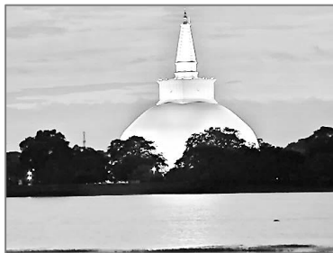
Η «Μαχά Στούπα», ύψους 103 μέτρων, όπου φυλάσσεται ευλαβικά μεγάλο μέρος των λειψάνων του Βούδα.

Εξάλλου υπάρχουν καταγεγραμμένες αρκετές βουδιστικές αφιερώσεις από Έλληνες της Ινδίας, όπως αυτή του Έλληνα μεριδάρχη (κυβερνήτη επαρχίας) Θεόδωρου, ο οποίος περιγράφει