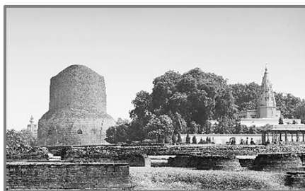
Η κολοσσιαία στούπα Νταμέκ στο Σάρ-

1. Αρχαιολογικά στοιχεία: Οι ανασκαφές στο Σάρνατ έχουν ξεθάψει πολυάριθμα τεχνουργήματα και κτίσματα που χρονολογούνται από την εποχή του Βούδα και μεταγενέστερες περιόδους. Ανάμεσα στις πιο σημαντικές ανακαλύψεις είναι η κολοσ-