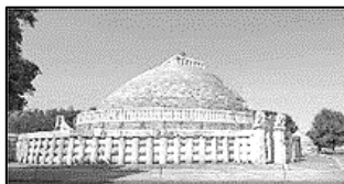
Δείγμα ενός ημισφαιρικού μνημείου (στούπα).

Σύμφωνα με τις ανασκαφές στο ημισφαιρικό μνημείο, διαπιστώθηκε ότι η πρώτη φάση της ανέγερσής του έλαβε χώρα τον 6ο αιώνα π.Χ., περίπου στην ίδια περίοδο με τον θάνατο του Βούδα. Αυτό προφανώς έγινε σύμφωνα με το αίτημα του Βούδα να τεθούν τα λείψανά του σε στούπα , όπως αναφέρεται σε μια Ομιλία του. 9 Στην ίδια Ομιλία γίνεται επίσης ρητά λόγος για τους Σάκυα ως εξής: «Οι Σάκυα έχτισαν μια μεγάλη στούπα στο Καπιλαβάτχου για τα λείψανα του Ευλογημένου». 10