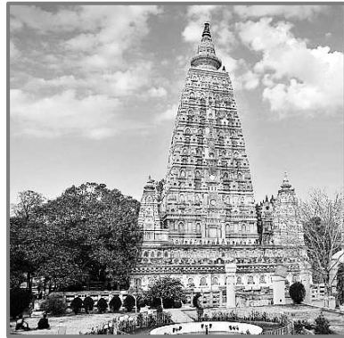
Ο Ναός Μαχά Μπόντι και το Δέντρο της Φώτισης στα αριστερά.

Ανάμεσα στα πιο σημαντικά ευρήματα στην Μποντ Γκάγια είναι ο επιβλητικός και μεγαλειώδης ναός Μαχά Μπόντι, που χρονολογείται από τον 5ο αιώνα μ.Χ., ο οποίος αναγνωρίστηκε ως τόπος παγκόσμιας κληρονομιάς από την Ουνέσκο, και το Βατζράσανα (Διαμαντένιο Κάθισμα), που θεωρείται ότι σηματοδοτεί το σημείο όπου ο Βούδας κάθισε και πέτυχε τη Φώτιση. Εδώ βρίσκεται και το δέντρο της Φώτισης, το οποίο αποτελεί άμεσο απόγονο του αρχικού δέντρου.