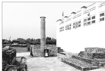
Ο Στύλος του Ασόκα στο Λούμπινη και ο ναός Μάγια Ντέβι.

1. Ο Στύλος του Ασόκα : Ένα από τα πιο σημαντικά στοιχεία είναι ο Στύλος του Ασόκα, που ανεγέρθηκε από τον αυτοκράτορα Ασόκα κατά τη διάρκεια της επίσκεψής του στο Λούμπινη το 249 π.Χ. Ο Στύλος φέρει μια επιγραφή με τους αρχαίους χαρακτηριστικές Μπράχμι ( Brahmi ) και γράφει μεταξύ άλλων τα εξής: «Εδώ γεννήθηκε ο Βούδας, ο σοφός των Σάκουα». 3 Τον μεγαλοπρεπή Στύλο μπορεί να δει κάποιος ακόμα και σήμερα. Η αυθεντικότητα και άλλων αρχαιολογικών ευρημάτων σε αυτόν τον τόπο έχει επιβεβαιωθεί μέσω μιας σειράς ανασκαφών μετά την ανακάλυψη του Στύλου το 1896.