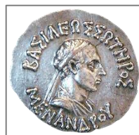
Νόμισμα του Μένανδρου. Πρόσθια όψη: «ΒΑΣΙΛΕΥΣ ΣΩΤΗΡΟΣ ΜΕΝΑΝΔΡΟΥ».

Ο Μένανδρος Α΄ ήταν ένας από τους βασιλείς του ινδοελληνικού βασιλείου από το 165 π.Χ. έως το 145 π.Χ., ο οποίος ασπάστηκε και προώθησε τον Βουδισμό, και στην ινδική παράδοση αποκαλείται Μιλίντα . Θεωρείται μεγάλος προστάτης του Βουδισμού. Οι διάλογοί του με τον βουδιστή μοναχό Ναγκασένα αποτελούν τη βουδιστική διατριβή γνωστή ως «Μιλίντα Πάνχα», που σημαίνει «Τα Ερωτήματα του Μιλίντα».